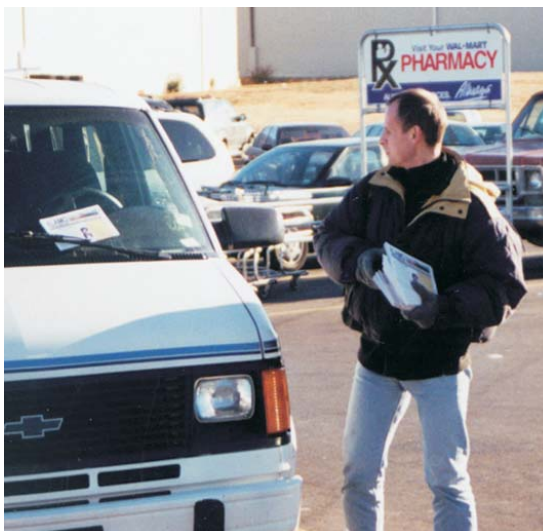
——來自斯洛文尼亞的J.F.弟兄在阿肯色州小石城散發阿拉摩牧師的福音著作。

在《約翰福音》第3章中，主告訴我們這些得拯救的人，我們如何才能在主在十字架上受刑和死亡中與祂聯合。“摩西在曠野怎樣舉蛇，人子〔耶穌〕也必照樣被舉起來〔舉到十字架上受難〕，叫一切信祂的〔這些人相信自己不但會隨耶穌同死，而且會在耶穌復活時與祂同生。《約翰福音》寫到，如果他們這樣做，他們就不會消亡會〕都得到永生〔因為他們為了他們以前的罪過在耶穌的死中死去了，而且又在祂的復活中與祂永生〕”（約3:14-15）。