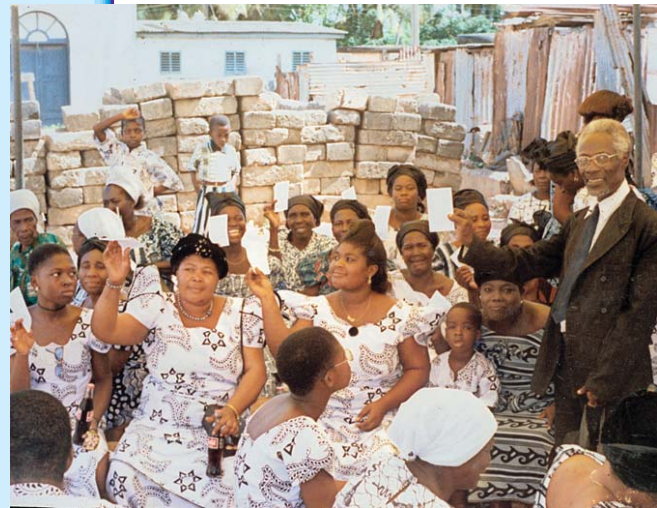
阿拉摩基督教會的副牧師E.O.和福音歌手以及阿拉摩牧師的著作和錄音信息的散發者們——西非洲，加納，鹽池