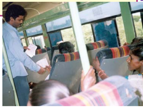
P.P. 牧師正在發放阿拉摩牧師翻譯成特魯古文的著作。印度，安德拉普大士省