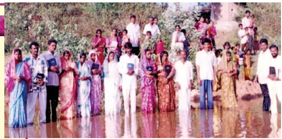
阿拉摩基督教會在印度海德拉巴附近的村莊為新的皈依者受洗。