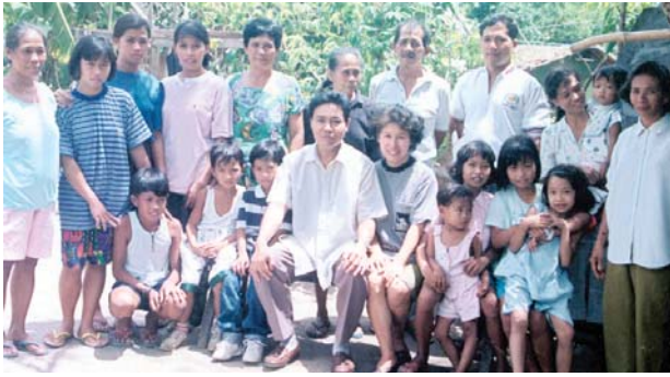
阿拉摩基督教會的助理牧師 C.A. 與其家人及會眾合影。菲律賓，南卡馬黎尼

這指的是神在我們心中及透過我們所做的神聖事業。就像空氣、水和食物在我們體內神秘地運作，以保持我們活著，身體強健；聖靈也在那些相信“為要成就祂的美意”的人心中神秘地運作，以使我們的屬靈堅強。神透過永生的氣息來餵養、灌溉及充滿我們，在靈性上滋潤我們，使我們趨於成熟， 46 充滿謙卑 47 和神的大能， 48 使我們內在的人屬靈堅強，好使神能透過我們說服世人在犯罪，證實天主的正義，並警告世人天主的審判（約翰福音 16:8）。我們一定要相信基督徒是神的殿堂、住處和房子。 49 祂住在我們心中，在我們體內工作，一如祂在基督體內工作，立志行事，為要成就祂的美意。