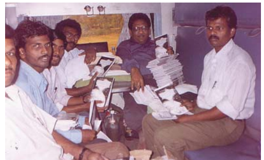
在火車上準備到下一站發放《彌賽亞》及其他著作。