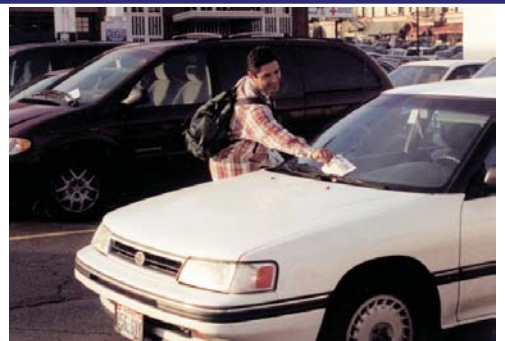
在華盛頓州的斯坡欽散發阿拉摩牧師改變人生的文章。