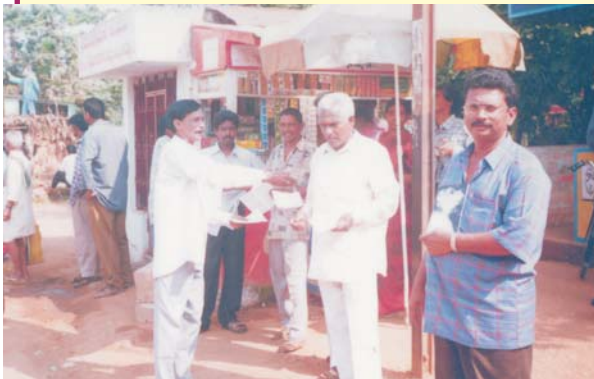
Distribution de la littérature du Pasteur Alamo dans les environs d'Hyderabad, Inde