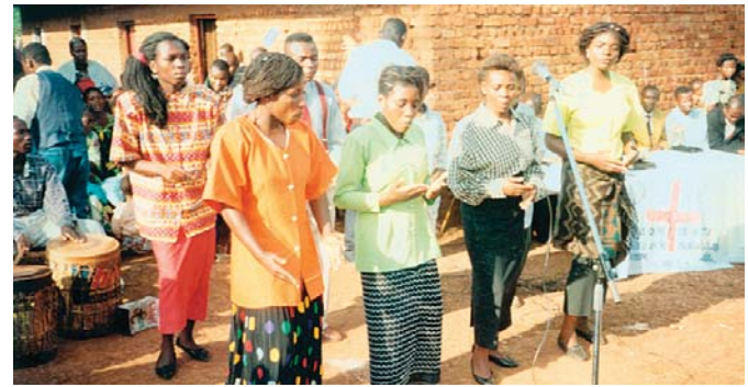
Distributeurs de la littérature évangélique chrétienne Alamo et Sœurs de la chorale adorant le Seigneur dans notre église, ici à Bukaru. – Christopher Masona, Cyangugu, Rwanda.

Pasteur G.G. Côte d'Ivoire Toutes les requêtes du Pasteur G.G. ont été accordées.