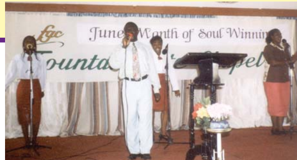
Ministre associé des Ministères chrétiens Alamo (Alamo Christian Ministries) S.D. avec des chanteurs participant à un service de louanges et de prières – Bolgatango, Ghana.

Les requêtes de J.A. lui ont été accordées.