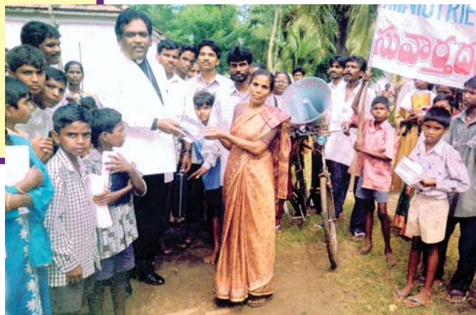
Frère C.L. évangélisant et distribuant la littérature du Pasteur Alamo dans les villages entourant Amalapuram, Inde.