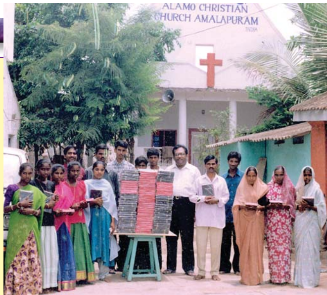
Distributeurs des Ministères chrétiens Alamo (Alamo Christian Ministries) avec des Bibles pour distribution—Amalapuram, Inde.