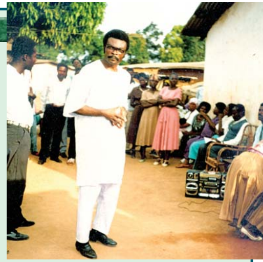
Pasteur associé des Ministères chrétiens Alamo B.A. témoignant dans un village –Cameroun, Afrique

Pasteur, j'ai été baptisé dans l'Église catholique il y a huit ans mais je n'ai jamais vraiment accueilli Jésus Christ dans ma vie, jusqu'en juillet 2000, quand j'ai commencé à fréquenter l'église à l'école. Pasteur, récemment, j'ai souffert d'une variété de problèmes de santé, et j'ai survécu par la grâce de Dieu. Maintenant, je souhaite vraiment suivre Dieu et accomplir Son œuvre toute ma vie, parce que si Dieu avait retenu contre moi mon passé, je ne serais pas vivant aujourd'hui. J'ai eu un très mauvais passé, une vie consumée par l'alcool, le tabac et la fornication, mais je remercie Dieu de m'avoir épargné jusqu'à ce jour, et je crois qu'Il a un plan pour moi. Pasteur, suite à ma lecture de votre bulletin d'information, je m'aperçois que je pourrais apprendre beaucoup de vous en lisant votre littérature biblique. S'il vous plaît, Pasteur, si Dieu le veut, envoyez-moi votre livre Le Messie , davantage de vos bulletins d'information, de la