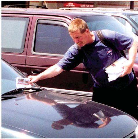
Les distributeurs de littérature Alamo sont plus nombreux chaque jour à travers le monde.

Les demandes de H.M. ont été satisfaites.