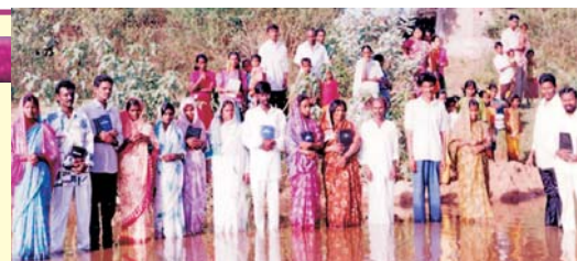
Baptême au sein des Ministères chrétiens Alamo (Alamo Christian Ministries) de convertis récents dans un village près de Hyderabad, Inde.