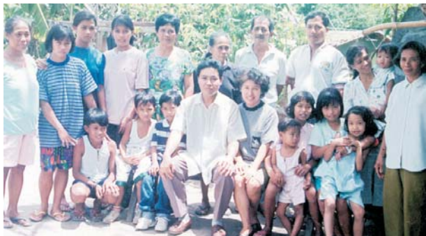
Pastor Associé des Ministères chrétiens Alamo (Alamo Christian Ministries) C.A. en compagnie de sa famille et de membres de la congrégation – Camarines Del Sur, Philippines