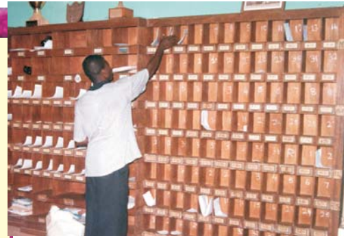
Ministre associé des Ministères chrétiens Alamo E.O. distribuant la littérature du Pasteur Alamo à l'université du Ghana.