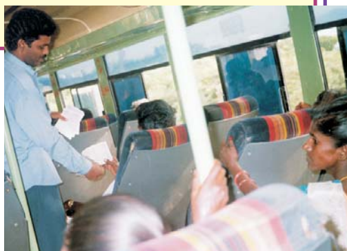
Pasteur P.P. distribuant la littérature des Ministères chrétiens Alamo, traduite en langue Telugu. – Andhra Pradesh, Inde