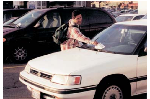
Les écrits du Pasteur Alamo qui transforment l'existence sont distribués à Spokane, État de Washington.