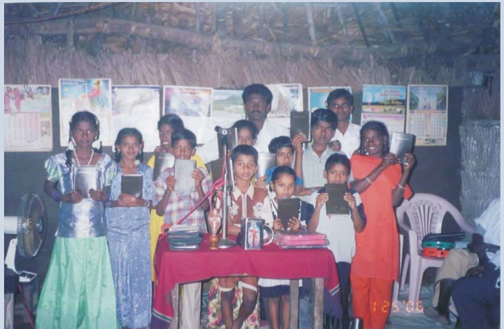
Les membres de la congrégation des Ministères chrétiens de Tony Alamo à Andhra Pradesh, en Inde, avec les copies du livre du Pasteur Alamo, Le Messie .