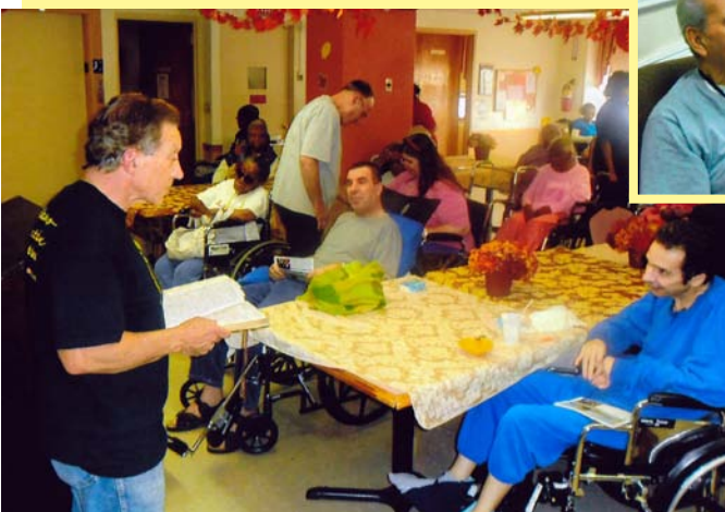
Les frères et sœurs du Ministère Alamo prêchant aux pensionnaires d'une résidence pour personnes âgées