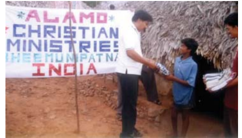
Alamo Christian Ministries Associate Minister, P.G., in Mission zu den Bedürftigen bei Bheemunipatnam, Andhra Pradesh, Indien