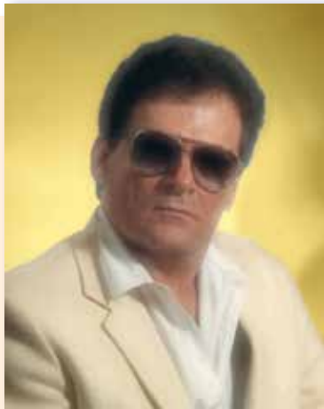
Pastor Tony Alamo—foto 1986