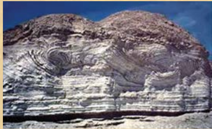
Sodomas un Gomoras apkārtņēs novērotie spirālveida zemes slāņi