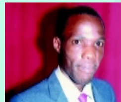
Brat W.E. – Kampala, Uganda

Powyżej – zgromadzenie Alamo Christian Ministries uwielbia Pana – Bolgatanga, Ghana, Afryka