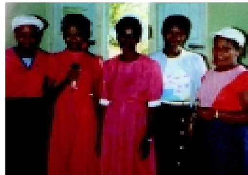
Śpiewanie hymnów w Indiach Zachodnich

Jezus powiedział swoim uczniom: „Pójdź... naśladowaj Mnie” (Ew. Mr. 8;34) 154 . Oni zaś natychmiast porzucili pracę i poszli za Nim 155 . Tak musi być i dzisiaj. Bóg powołuje każdego do swego ciała, w którym może On mieszkać i działać, by ludzie zostali zbawieni oraz by nie poszli do piekła 156 . On chce zamieszkiwać i