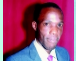
Brat W.E. – Kampala, Uganda

Powyżej – zgromadzenie Alamo Christian Ministries uwielbia Pana – Bolgatanga, Ghana, Afryka