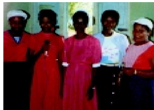
Śpiewanie hymnów w Indiach Zachodnich

Jezus powiedział swoim uczniom: „Pójdź... naśladowaj Mnie” (Ew. Mr. 8;34) 154 . Oni zaś natychmiast porzucili pracę i poszli za Nim 155 . Tak musi być i dzisiaj. Bóg powołuje każdego do swego ciała, w którym może On mieszkać i działać, by ludzie zostali zbawieni oraz by nie poszli do piekła 156 . On chce zamieszkiwać i