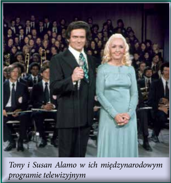
Tony i Susan Alamo w ich międzynarodowym programie telewizyjnym