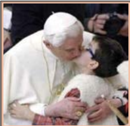
Były papież Joseph Ratzinger całuje młodego parafianina.