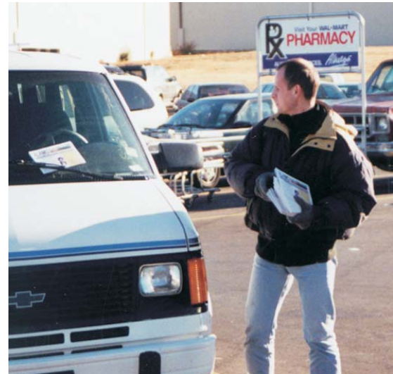
Брат Й. Ф. из Словении распространяет евангелическую литературу Аламо в Литтл Рок в Арканзасе.

В третьей главе Евангелия от Иоанна Господь объясняет тем из нас, кто спасен, как мы соединяемся с Ним в Его распятии на кресте и в Его смерти: “И как Моисей вознёс змию в пустыне, так должно вознесены быть [умереть на кресте] Сыну Человеческому, дабы всякий верующий в Него [верующий в то, что он не только умрёт с Ним, но и будет жить с Ним в Его воскресении] не погиб, но имел жизнь вечную [поскольку умирает он в Его смерти за свои прошлые грехи и жить будет с Ним вечно в Его воскресении]” (От Иоанна 3:14-15).